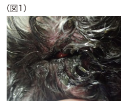
図1 激しい眼瞼周囲の炎症、眼脂を伴う結膜炎

実際、このような小さな虫がわんちゃん目の中に住んでいるとはなかなか想像つかないかもしれませんが、当然ですが、このような虫が目の中に寄生する（住む）と激しい炎症や不快感を生じます。この写真（図1）のわんちゃん目を見ていただくと、かな