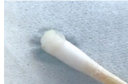
図4 滅菌綿棒を用いて除去した東洋眼虫